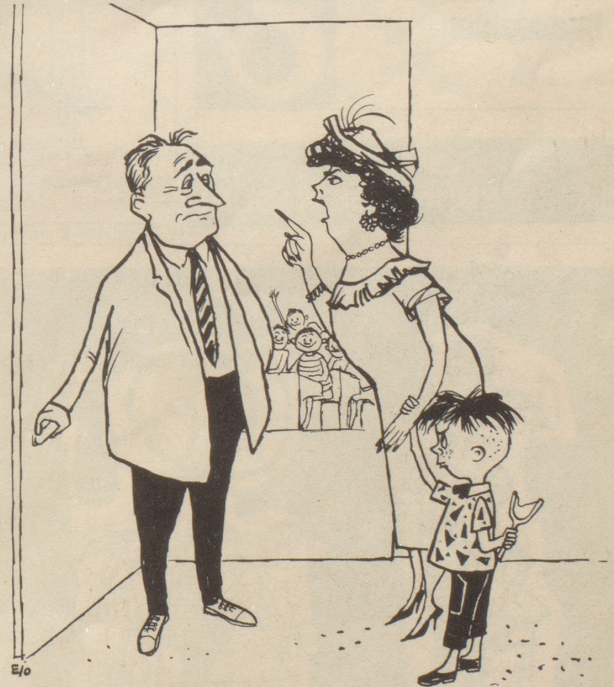
«Herr Lehrer, min Reinhold isch kein Luusbueb, lönd Si sich das gsait sii!»