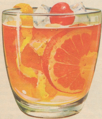
Old Fashioned 1 Teelöffel Wasser, 1 Stück Würfelzucker mit 2-3 Tropfen Angostura-Bitter, viel Eis, 40-50 gr. Four Roses darübergießen, mit Zitronen- und Orangenscheiben garnieren, obendrauf eine Maraschino-Kirsche.