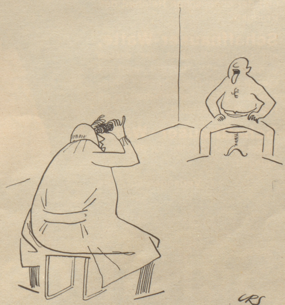
Der vorsichtige Arzt «Ich vermute Grippe.»