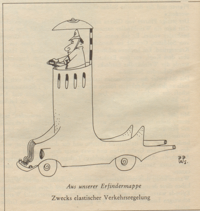
Aus unserer Erfindermappe Zwecks elastischer Verkehrsregelung

Ferien gönnt er sich kaum, denn als Oberstleutnant muß er in seinen Mußwochen die Probleme der Landesverteidigung lösen helfen. Man würde es kaum glauben, aber es stimmt: dieser energische, ums Gemeinwohl so besorgte weltoffene Mann findet abends noch Zeit, nach Konstanz zu fahren, um dort den Kontakt mit dem benachbarten deutschen Volk zu pflegen!»