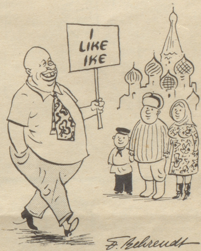
Vielleicht hilft es!