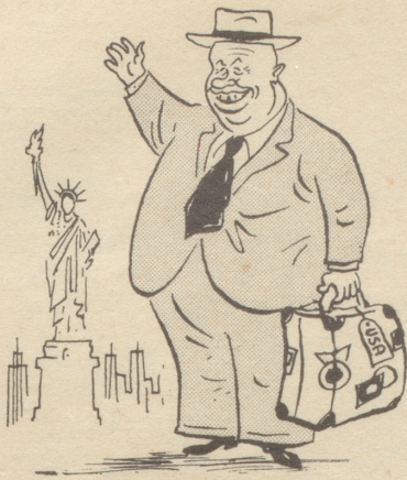
Laßt ihn kommen ...