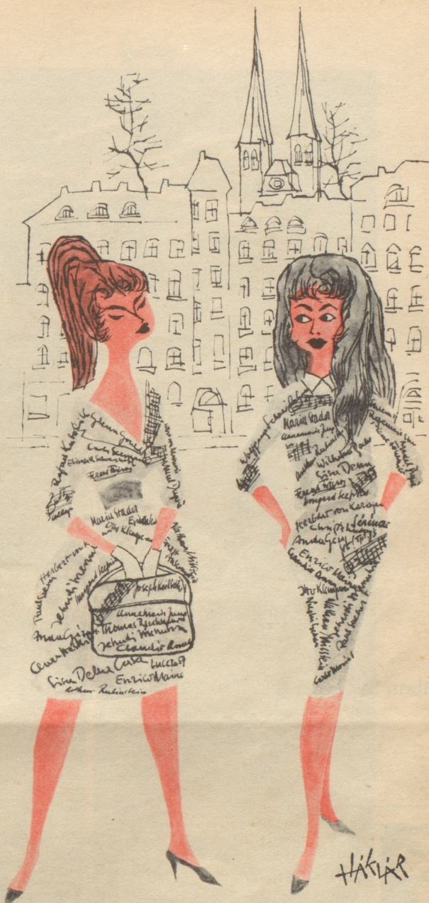
Autogramm-Jägerinnen verlassen die Luzerner Musikfestwochen!