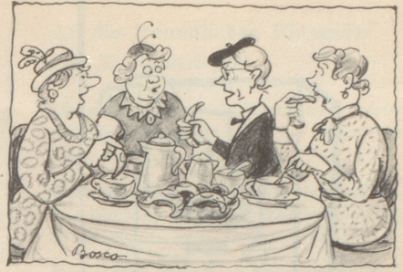
Au e Gipfelkomferenz wo nöd vill drbii uselueget