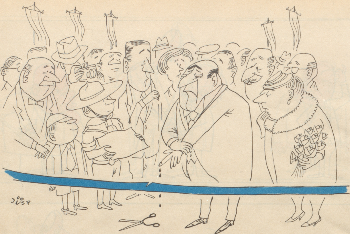
Die aberheite Einweihung