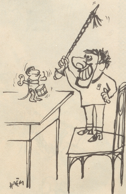
Der Tag vor dem Morgenstreich