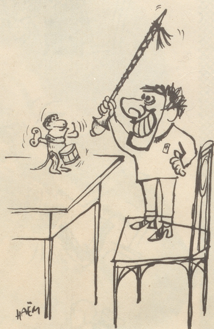
Der Tag vor dem Morgenstreich

«So, so», staunt Bobby. «Und wie hieß die Stadt vor dem Erdbeben?» *