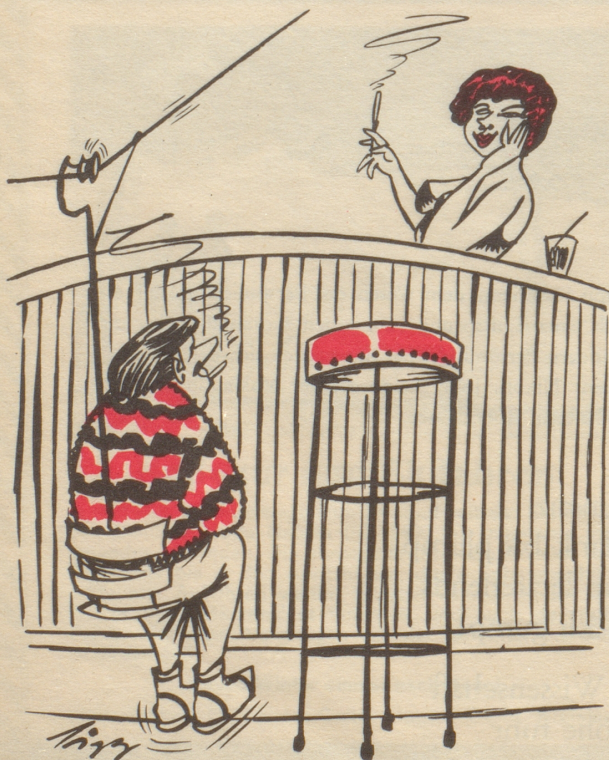
Der Barlift Dienst am Kunden

So, und jetzt werde ich die zu kurze Nestel meiner Schuhe zunesteln. Mög die Nestelschnur heute ausreichen! Und mir gnädig sein!