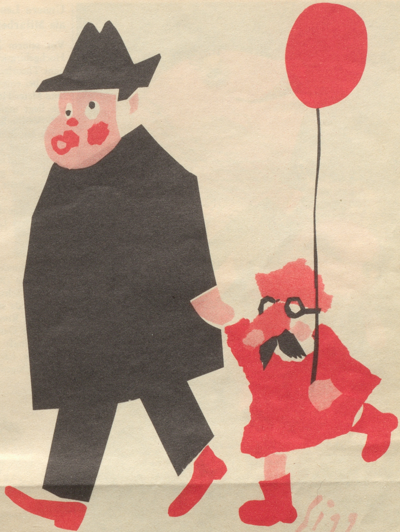
Vater und Sohn an der Fasnacht