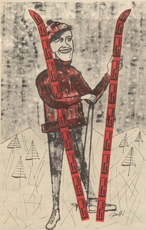
FRIDA DÄNZER Skiweltmeisterin

«Wir haben uns nun doch für das frühere Modell der Hausangestellten entschlossen.»