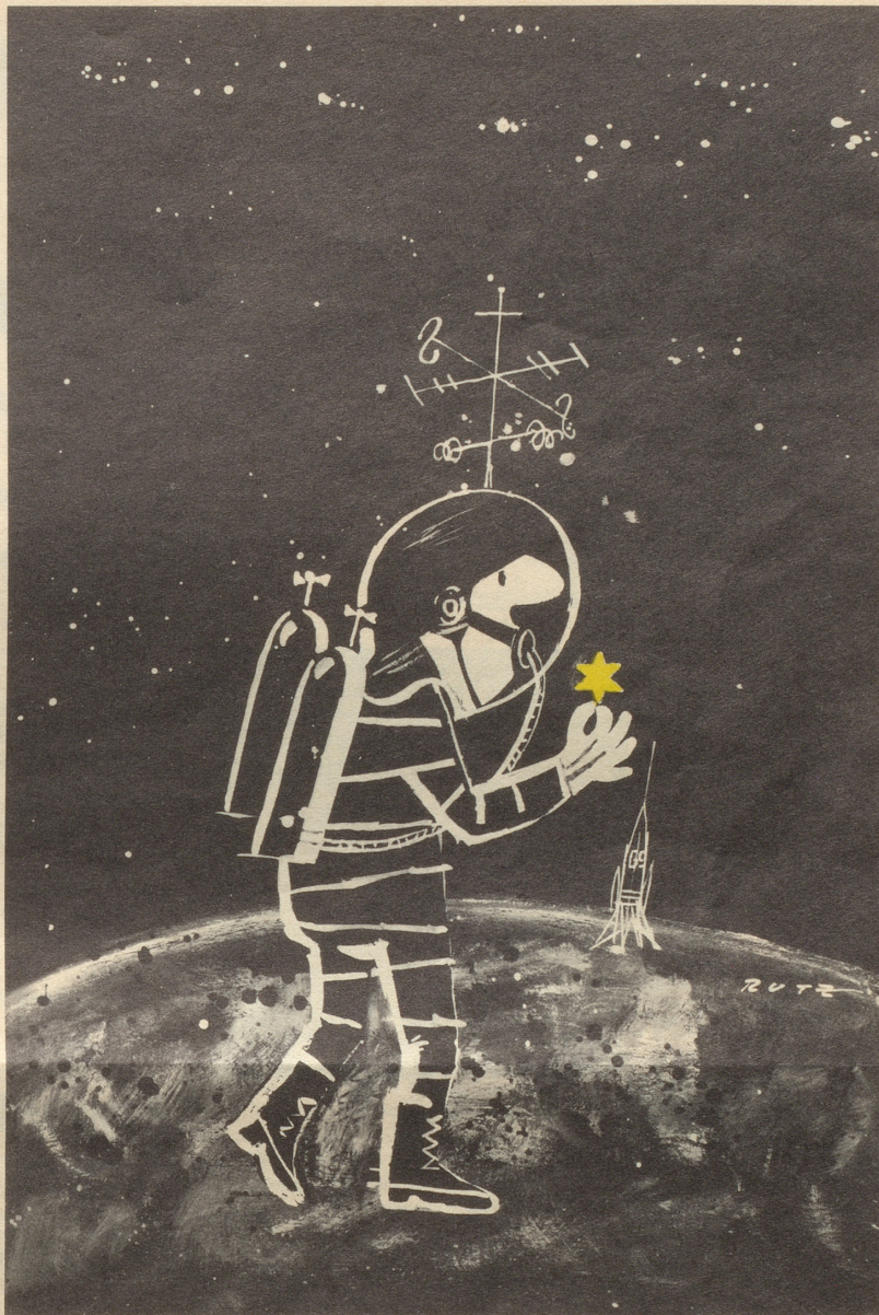
Weltraumfahrer bringt Souvenir nach Hause

«Du, Karl, wänn wämmer dänn hüürate?» «Muesch na e chli warte, Liebs: Sobald dLäbeschoschte abegönd ...» bi