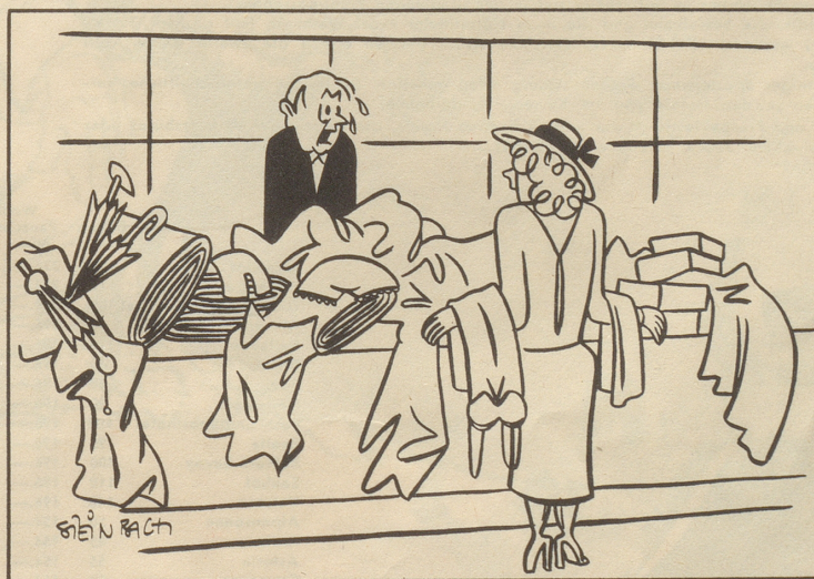
«Entschuldigezi wüessed Sie vilicht na was ich urschprünglich ha wele chauffe?»