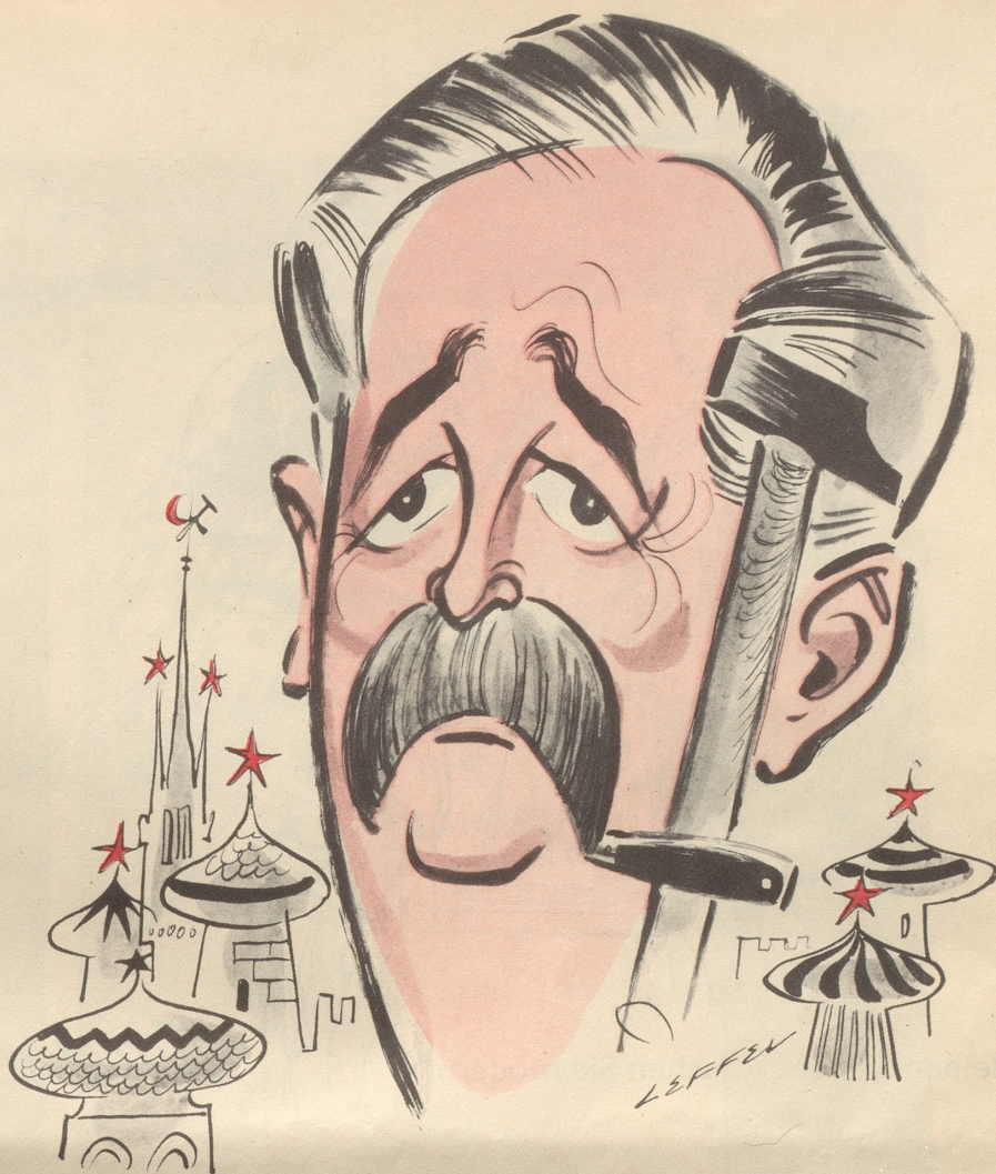
Das Portrait der Woche: Harold Mac M...oskau

Joachim Eisenkopf ist ein Fanatiker und er gibt es auch gerne zu. «Was ich einmal für richtig befunden habe», so erzählt er am Stammtisch, «das führe ich dann auch eisern durch.» Und so steht er jeden Morgen eine halbe Stunde früher auf, um seine Morgengymnastik durchzuführen, er ißt nur noch Biologisches Gemüse, er trinkt nur noch alten Burgunder, fährt nur noch Autos mit Vorderradantrieb, raucht nur schwarze Zigarren und kleidet sich nur in Tweed. Aber gemütlich und geschmackvoll ist er zu Hause eingerichtet, denn da ist er auch fanatisch: Orientteppiche kauft er nur bei Vidal an der Bahnhofstraße in Zürich!