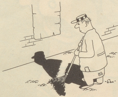
Der gewissenhafte Straßenkehrer!

«Wenn i nid sälber albeneinisch chly gnoh hätt, hätt i ds Padänt nid usegslage.» FL