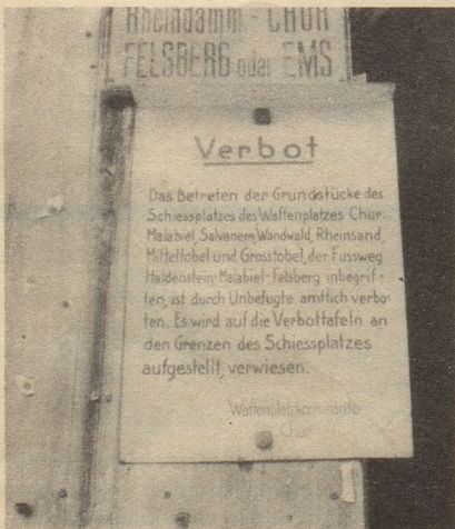
Unbefugte erlassen amtliche Verbote!