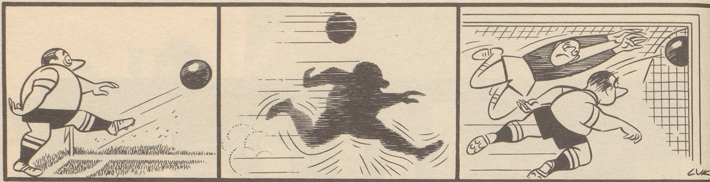
Das ist Schnelligkeit: Wenn der Linksaußen flankt, den fliegenden Ball überholt, um ihn selbst ins Tor zu befördern ...