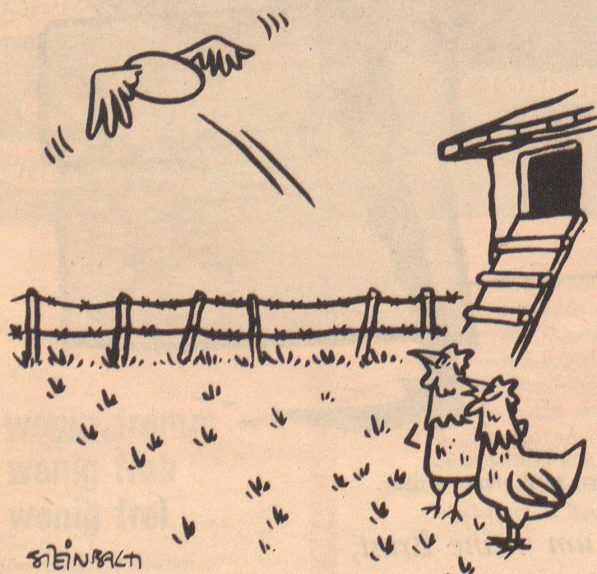
«Mein Jüngstes ist ein bißchen frühreif.»