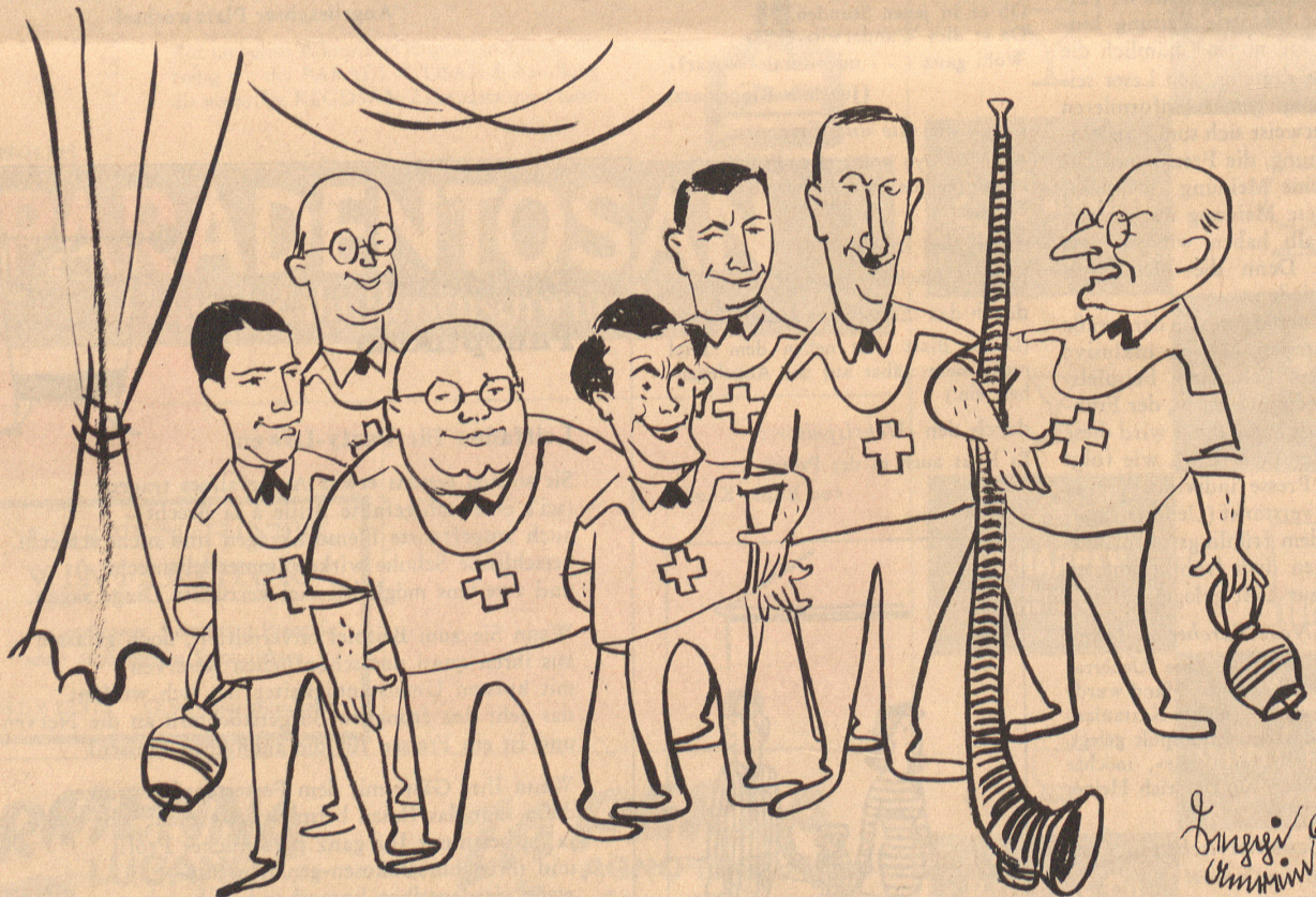
Die erste Gesamtaufnahme 1960