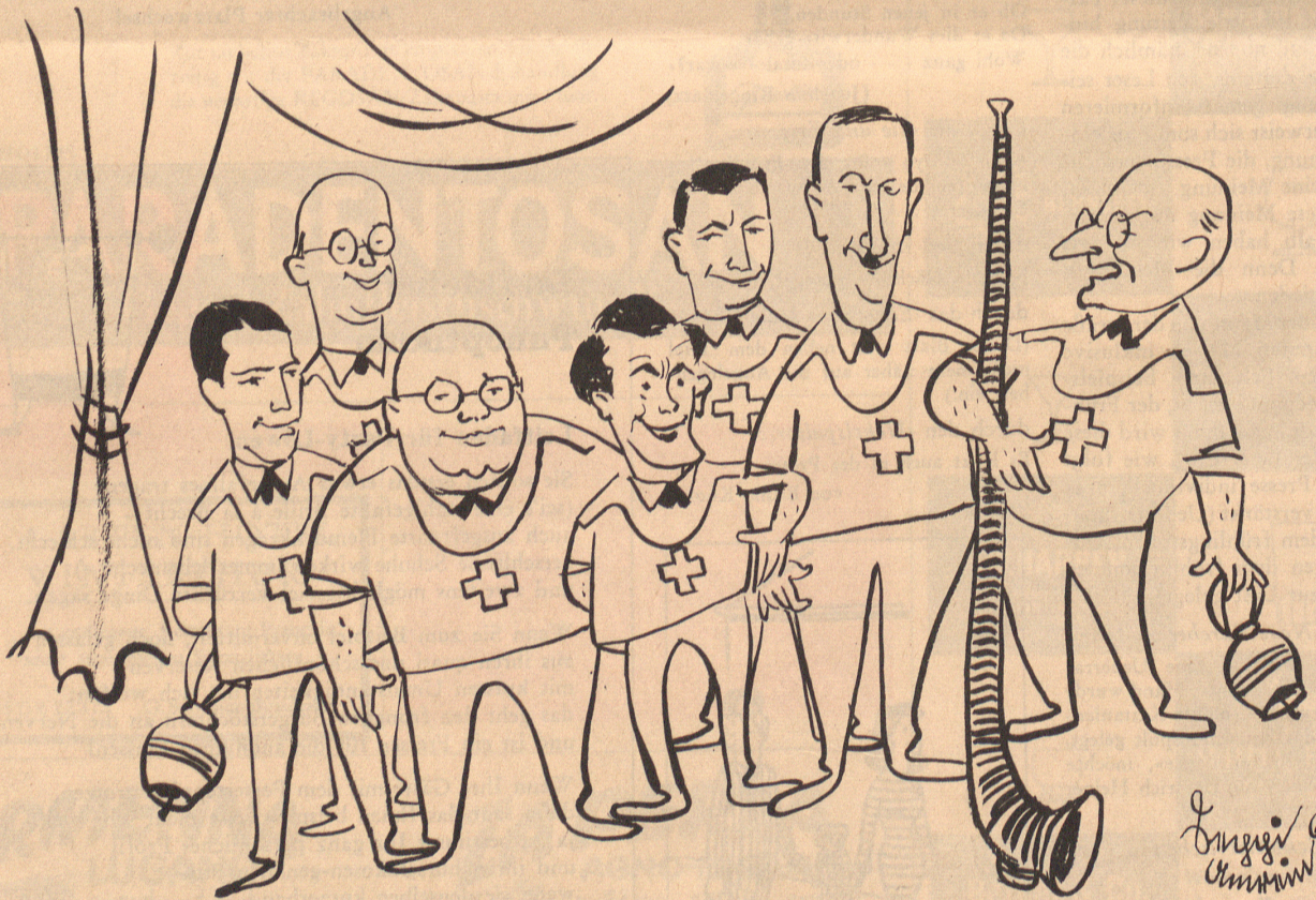
Die erste Gesamtaufnahme 1960