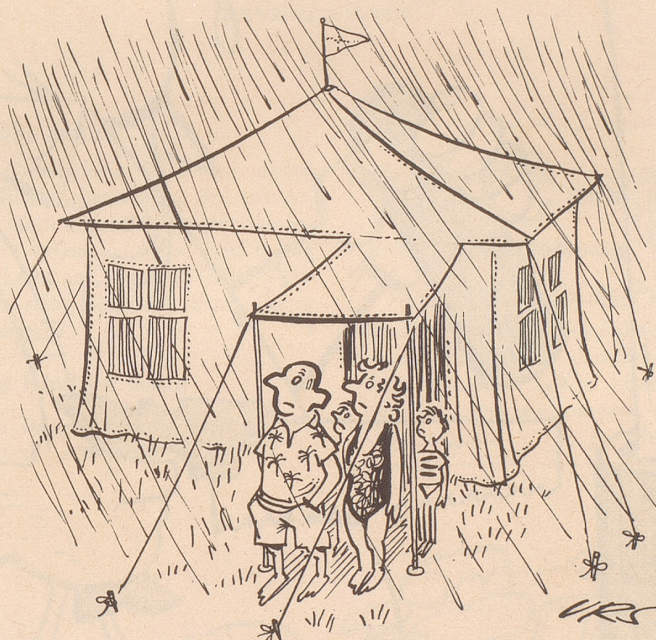
in den Ferien