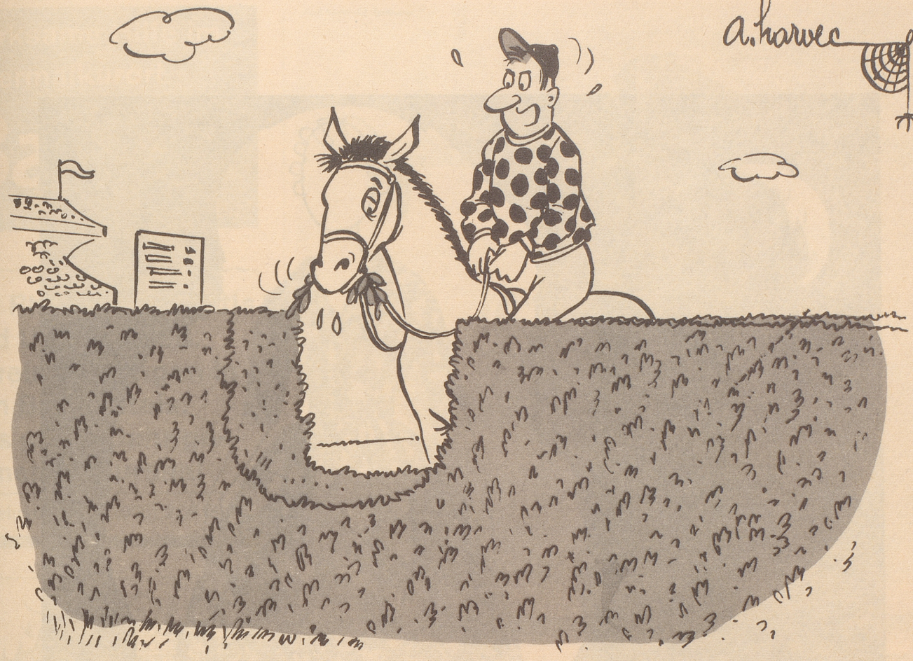
So nimmt kluges Pferd eine Hürde