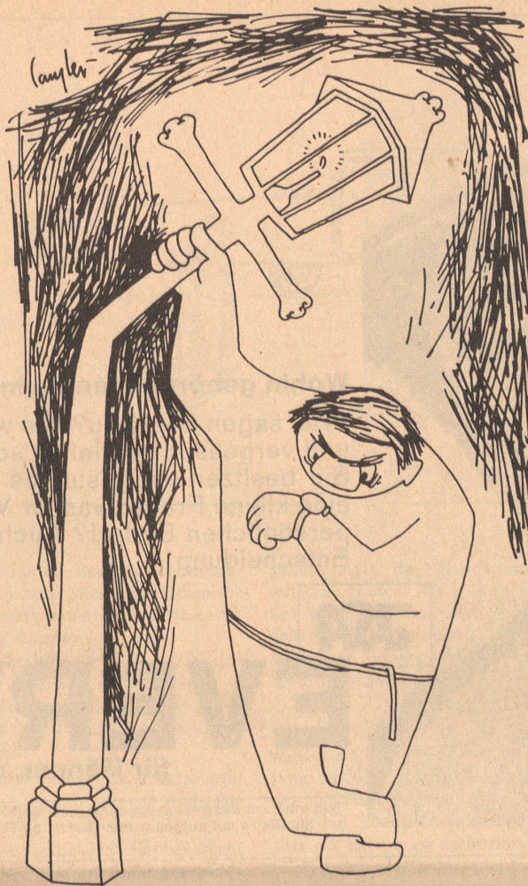
Schon so spät!

Auf einem weit ausbauchenden Giltsteinofen steht das Wappen der Gemeinde mit der Jahrzahl des Entstehens ihrer Stube. Ob sie auch das Geburtsjahr jener Anekdote ist? Wer weiß es? Jahrhunderte sind seitdem verflossen. Aber auch die Heutigen sitzen noch auf klobigen Bänken an langen Tischen und lassen sich von den Ratsherren Wein einschenken aus Zinnkannen, wie deren ringsum an den Wänden mehr prangen. Je origineller die Gemeinde ist, umso mehr Zinnkannen besitzt sie. Im abgeschlossenen Eifischtal gibt es solche, in deren Stube und Keller an hundert und mehr Zinnkannen gezählt werden können,