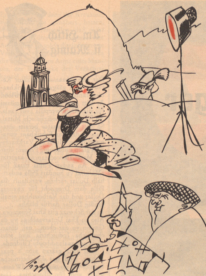
Laut Bericht in der «Südschweiz» soll bei Lugano ein deutsches Filmstudio entstehen.

Die Küttiger bei Aarau sind eine tüchtige, arbeitsame Rasse. Jüngst wurde ein Arzt zu einer Sterbenden gerufen. Sie saß aufgerichtet im Bett und wußte, daß es mit ihr zu Ende ging.