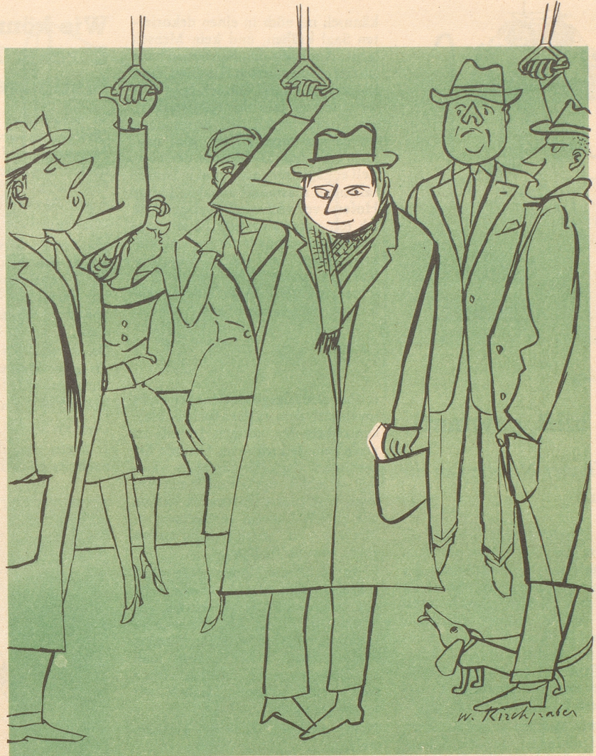
Der Herr mit dem räßen Chäas im Sack

«So, jetz chunnt no s Tüpfli uf s i», jetz