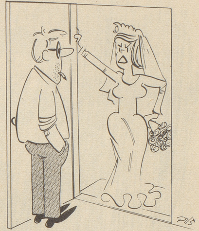
«Doch doch, auf den heutigen Tag haben wir uns angemeldet!»