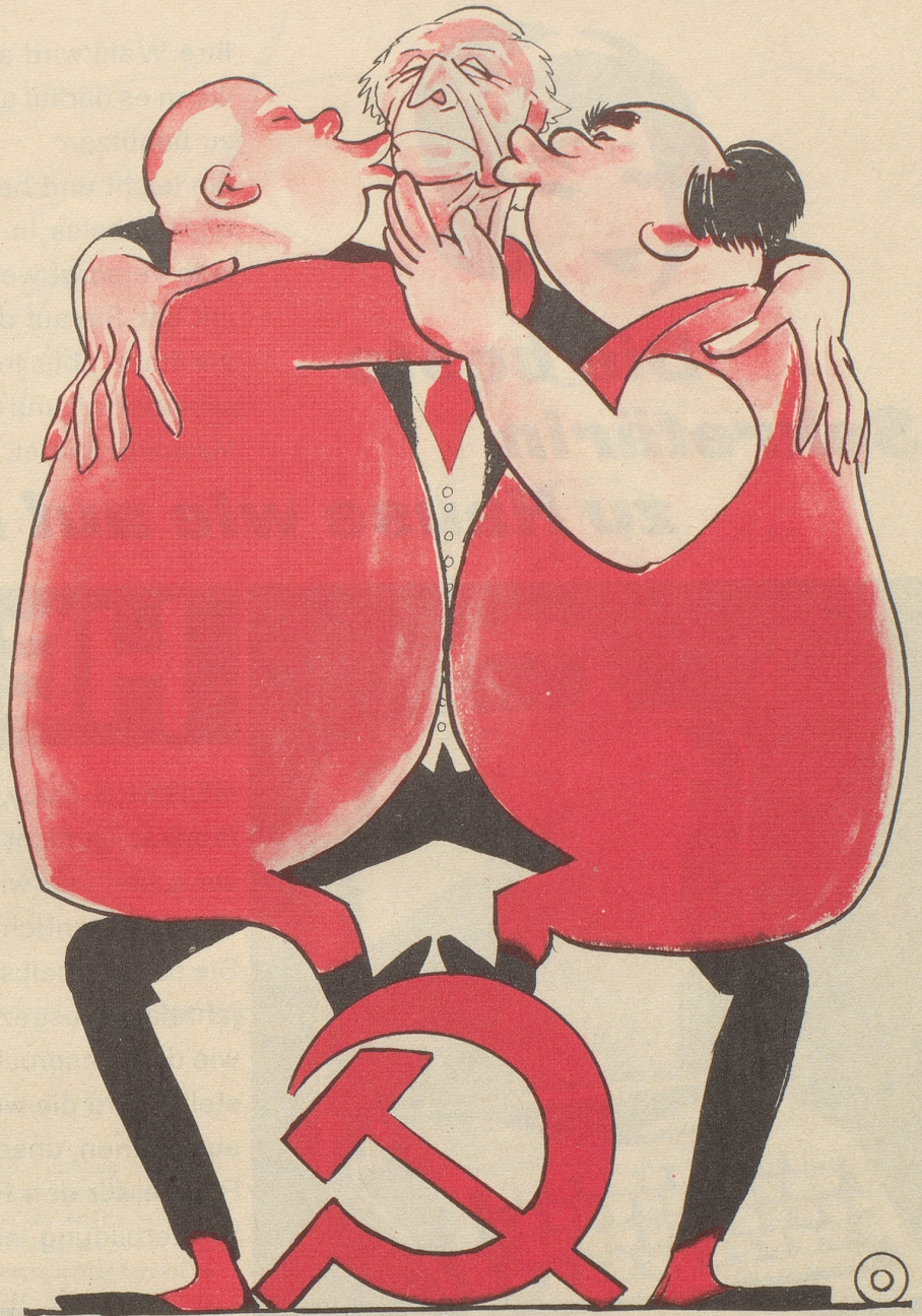
Monty im Osten viel geliebt!

Bei manchen Menschen genügt es nicht, daß man ein Auge zudrückt. Man sieht mit dem andern immer noch zuviel Fehler. -om-