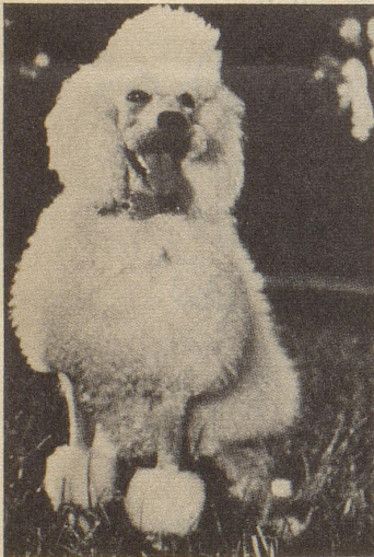
Die Pudelhündin Aroya aus dem Zwinger de Casa siesta

A paar Schnuddari vu Züri sind mit iarna Motoorwelo gan Italja aaba khnattarat. Uff Como. Döt dunna hend si sich uufgfürt, daß Gotterbaarm! Ummagsoffa, ggröolat, Lampa oobanaaba gschlaaga, dLütt aagremplat – solang, bis si vu dar Polizeij päckhlat worda sind. I hoffa, dia Luusbuaba sejand nitt mit Samathentscha aaglangat worda. Wenn ii zComo dunna Polizischt gsii wääri, denn hettis khlöpft! I waiß nitta, was dia miissa Vöögal für a Schtroof khriagt hend. Ob nu a Buaß, odar a paar Taag Loch mit Broot und Wassar. Abar mii teeti aswas intressiara: Khamma söttigi Schnuddari nitt schtroofa, wennis zrugg in dSchwizz khömand? I waiß, as git khai Gsetz, mäga demm aina khann gschtrooft wärda «wegen ungebührlichem Verhalten im Ausland». Susch hettandi miar jo zweenig Zuchthüüsar ... Abar aswas khönnti in üüsaram