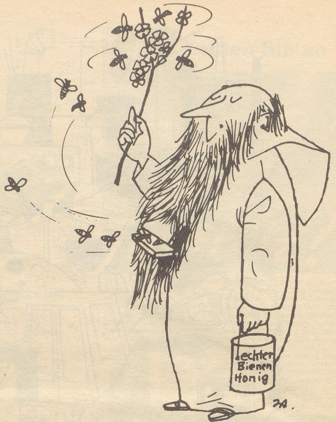
Von der Genügsamkeit