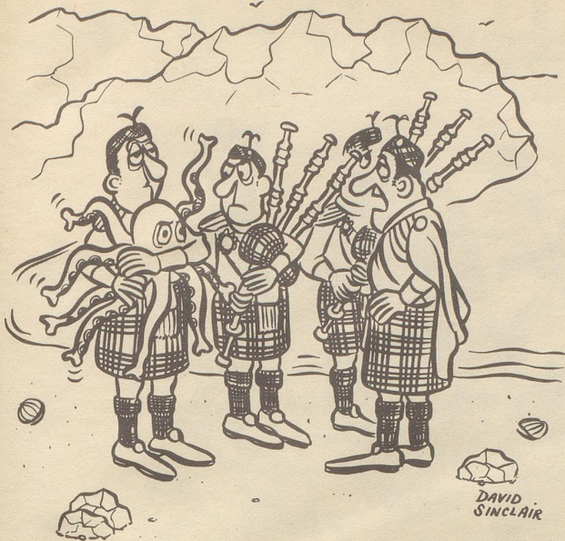
Einer von der schottischen Strandkapelle hat seine Brille vergessen.