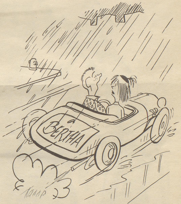
Platzregen «Schaad etz wird de Wage naß.»