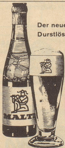
Der neue Durstlöcher

MALTI ist das erste und einzige im Dual-Verfahren aus Hopfen und Malz gebraute Bier – alkoholfrei und doch rassic.