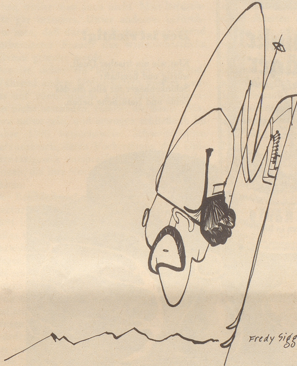
Der Schweizer Willy Forrer fährt in der italienischen Ski-Geschwindigkeits-Weltmeisterschaft 163 Stundenkilometer ...

Wir, die wir von Herbst bis Pfingsten Skisport trieben, wir vermißten den Rekord nicht im geringsten — — Willy, bleib bei deinen Pisten!