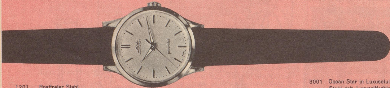
1201 Rostfreier Stahl Zifferblatt mit Reliefzahlen und Leuchtzeichen Fr. 180.—