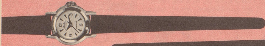
619 Rostfreier Stahl Zifferblatt mit Reliefzahlen Goldplaqué Midoluxe Fr. 235.— Fr. 250.—