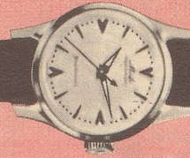
821 Rostfreier Stahl Zifferblatt mit hoch- geschliffenen Reliefzahlen und Leuchtzeichen Fr. 215.—