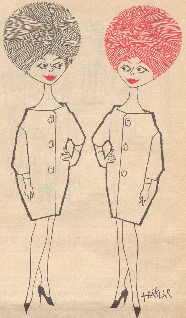
Mutter und Tochter

Wasser gefriert bei 0 Grad Celsius, Luft erst etwa bei minus 273. Beim Menschen, der zwar erstaunlich tiefe Temperaturen aushalten kann, friert zuerst die Nase, dann die Ohren und dann die Füße. Ungemütlich aber wird es ihm schon lange vorher. Gemütlichkeit und Wärme hingegen bringen in jedem Raum die wundervoll weichen Orientteppiche von Vidal an der Bahnhofstraße 31 in Zürich.