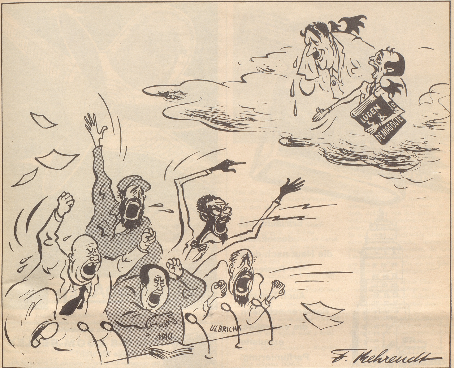
«Ist das ein Erfolg mein Führer?!»