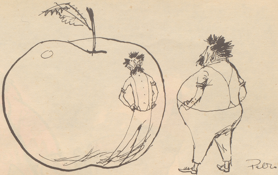
Schlanksein beginnt mit einem Apfel...