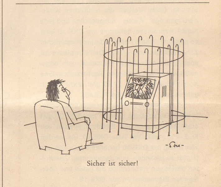
Sicher ist sicher!

Das haben wir alles nun xmal gehabt! Schon in der Hitlerzeit hatten wir es. Und deshalb muß, soweit es mich angeht, nun endgültig Schluß damit sein.