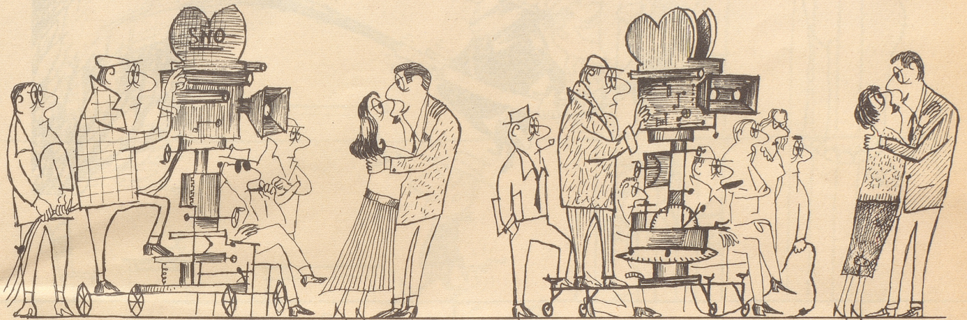
Die Geschichte des Films in vier Bildern