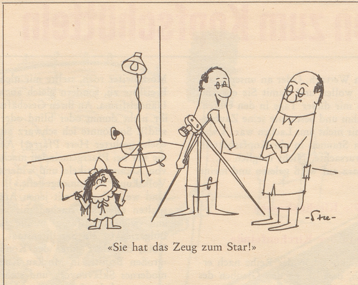
«Sie hat das Zeug zum Star!»