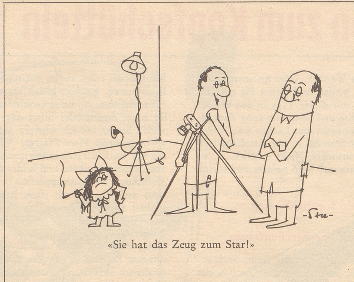
«Sie hat das Zeug zum Star!»