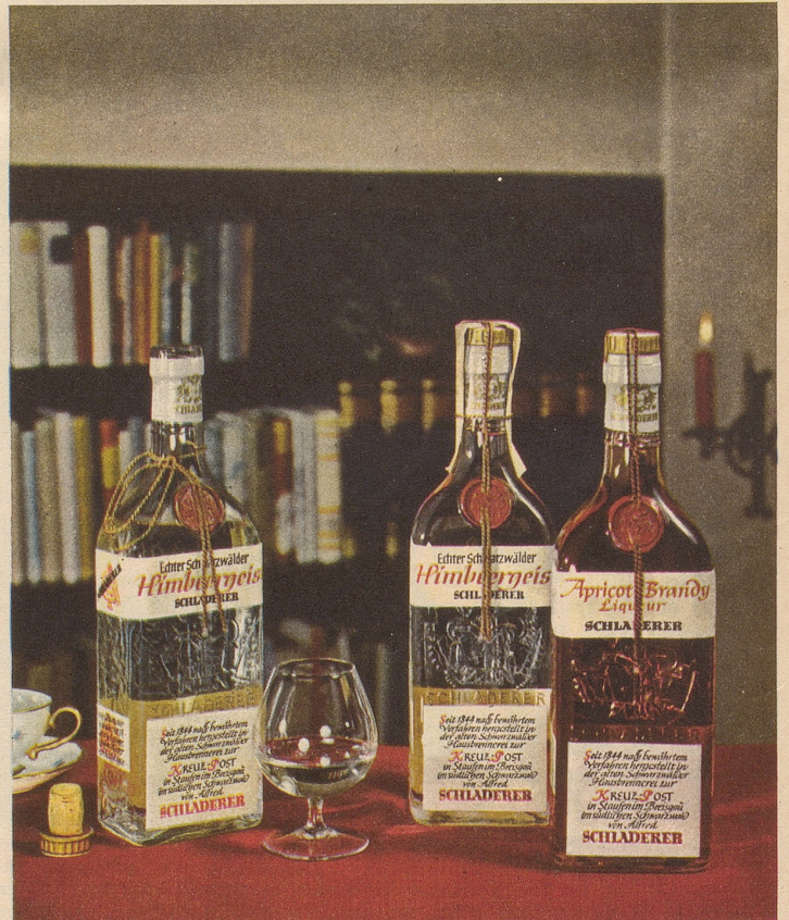
SCHLADERERS echter Schwarzwälder Himbeergeist und Apricot

Schon der Duft verbeißt höchsten Genuss – das vollkommene Aroma übertrifft Ihre Erwartungen!