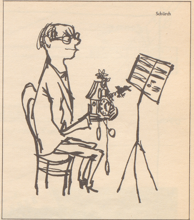
Komponist hört auf die Stimmen der Natur