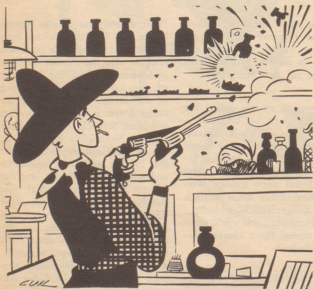
«... Sie liebt mich von Herzen, – mit Schmerzen, – ein wenig, –» ...