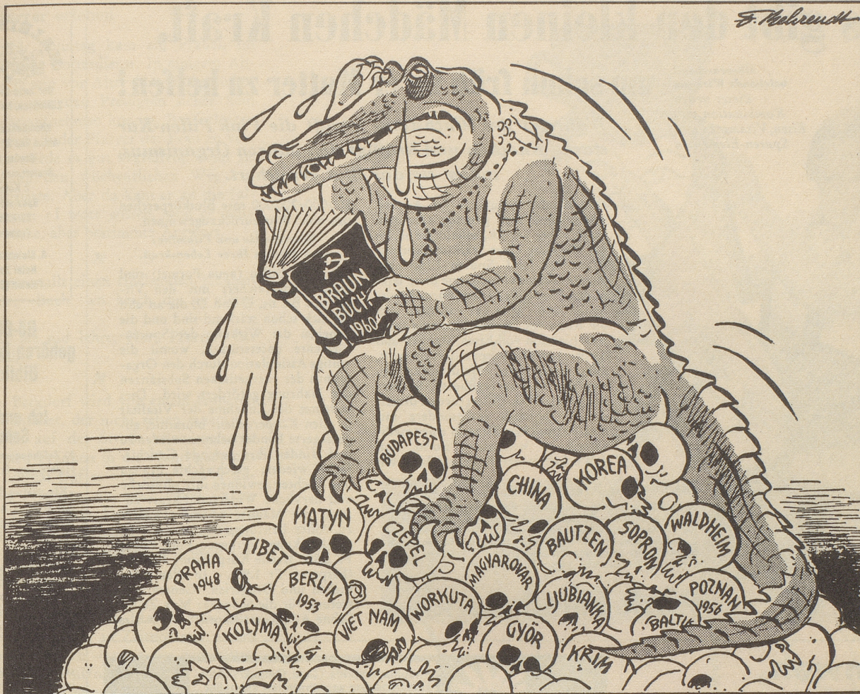
In Ost-Deutschland ist ein Braunbuch über die «Verbrechen» West-Deutscher Politiker erschienen

«Oh, was gibt es doch für böse Menschen in Bonn!»