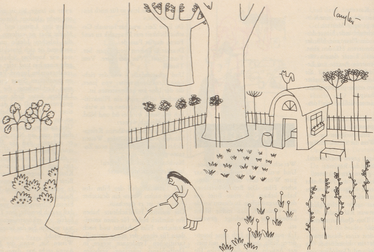
Auch Erwachsene bedürfen der Fürsorge!