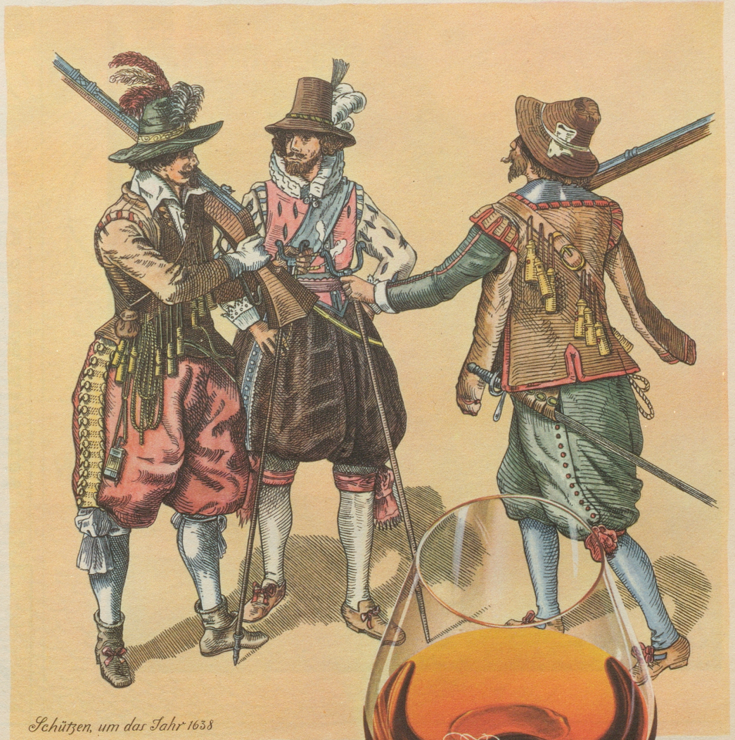
Schützen, um das Jahr 1638