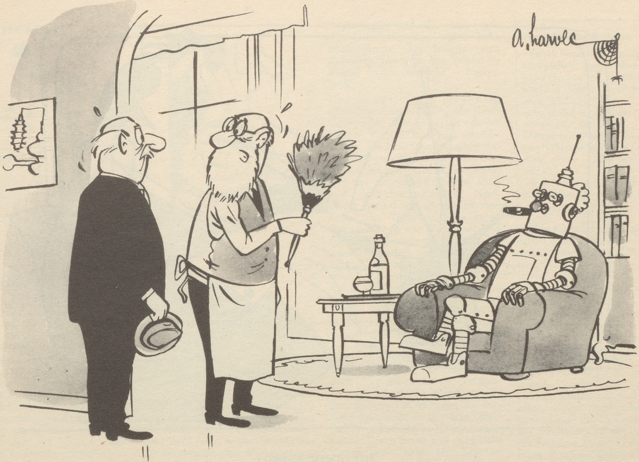
«Ja, ich habe ihn konstruiert. Aber falsch. Jetzt befiehlt er mir!»

ben aus den Ruinen blüht, und ihr sollt einig, einig, einig sein!»